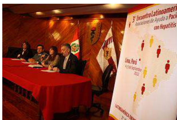
En la foto representante de OPS Perú, Ministerio Salud Perú y HCV Sin Fronteras