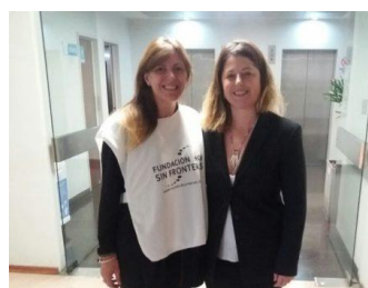
C.Gaillard presidente Comisión Salud Diputados de Nación