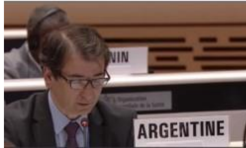
Argentina, delegación que encabezó el Ministro de Salud, Dr. Jorge Lemus, respaldó la Estrategia en nombre de los países de la región y que conforman el GRULAC

5-Propuesto: Día Mundial de las hepatitis, bajo el lema global unificado con el objetivo de la OMS sobre eliminar las hepatitis para el año 2030, promover unificar actividades y acciones, de acceso, diagnóstico y tratamientos, alineados con el movimiento global.