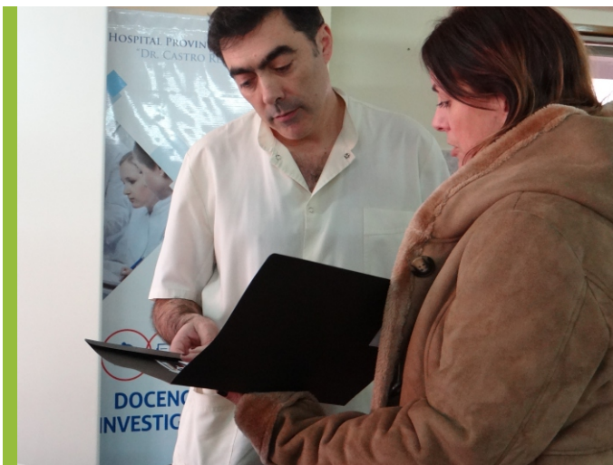
>Hospital Castro Rendón de Neuquén - Dr. Nimo Servicio de Gastroenterología

Bajo el lema "Construyendo un futuro para pacientes con enfermedades del hígado" y con la participación de destacados expertos en la salud hepática brindamos simposios para profesionales de la salud en las provincias de Neuquén y Tucumán contamos con la presencia de representantes del Ministerio de Salud de la Nación, el Ministerio de Salud de Neuquén, el Colegio Médico de Tucumán, referentes de los principales hospitales públicos de las provincias y la asistencia de más de 300 personas que participaron activamente. También en estas ciudades realizamos