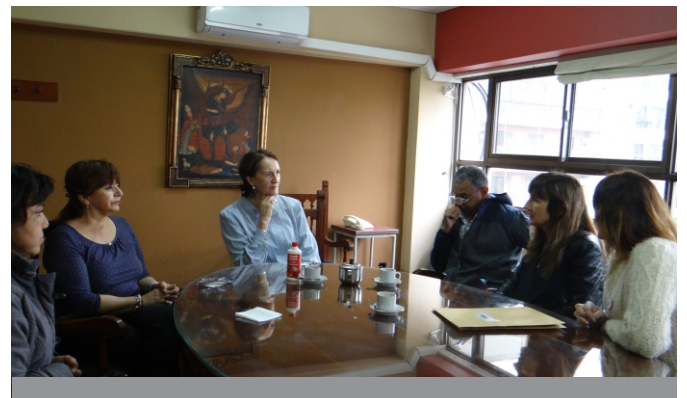
> HCVSF en reunión con el Colegio Médico y Fundación Trasplante y Vida de Tucumán