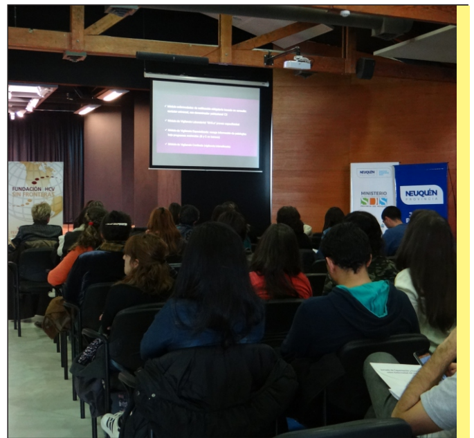
>Jornada Capacitación Neuquén

capacitación para ONG's y la comunidad en general, a todos los participantes se les ofreció vacunación para hepatitis B.