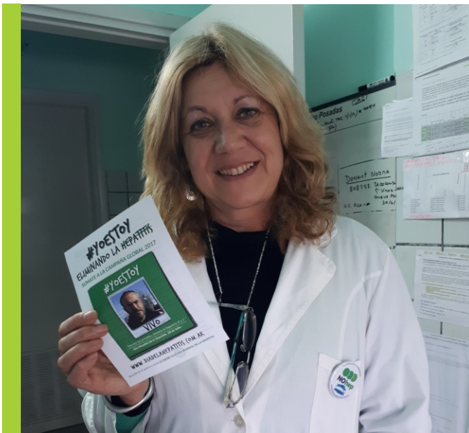
> Hospital Posadas - El Palomar - Buenos Aires

Recorrimos hospitales públicos del conurbano bonaerense y de diferentes provincias y conocimos las dificultades que afrontan los profesionales de la salud para diagnosticar tempranamente enfermedades del hígado como hepatitis viral crónica o cáncer de hígado. El nivel académico de profesionales especializados en nuestro país es excelente, lamentablemente no siempre cuenta con los recursos humanos para hacer frente a la gran demanda de atención, lo cual implica que llevar adelante campañas de sensibilización o testeos especialmente en puestos de salud periféricos es difícil. Los retrasos en los turnos, los problemas económicos, los traslados que afrontan las personas alejadas de los centros urbanos es un problema para hacer estudios de diagnóstico, seguimiento, etcétera.