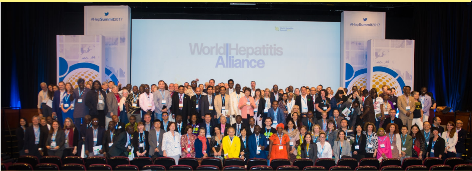
>HCVSF en World Hepatitis Summit San Pablo, Brasil 2017