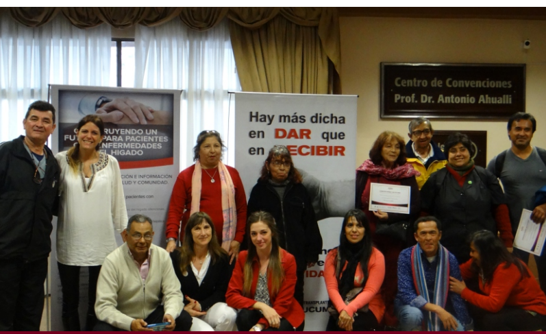
> HCVSF y HepaRed Argentina - ONG Futravit Tucumán

formó parte de las bandas de Mick Jagger, Mike Oldfield, Billy Preston ; Saafara Hepatitis de Senegal, Kumira de Ecuador, Asuntos Sociales de la Embajada de Francia en la Argentina, entre otros. Fortalecimos nuestro trabajo con World Hepatitis Alliance, el movimiento NOhep y la Organización Panamericana de la Salud.