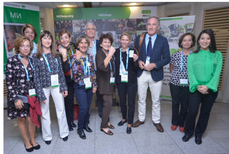
> HepaRed Latinoamérica y Caribe- OPS y World Hepatitis Alliance