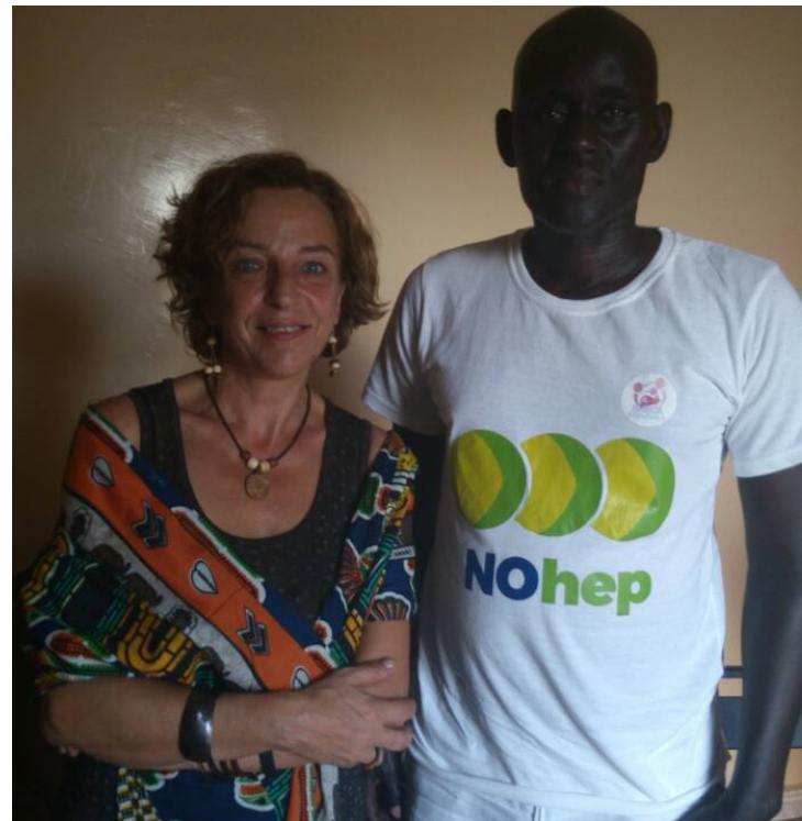
> HCVSF en Senegal junto a ONG SAHAARA Hepatitis

Establecimos relaciones de cooperación también con organizaciones e instituciones como Hep C positivo de Inglaterra ONG del famoso bajista Phil Spalding quien