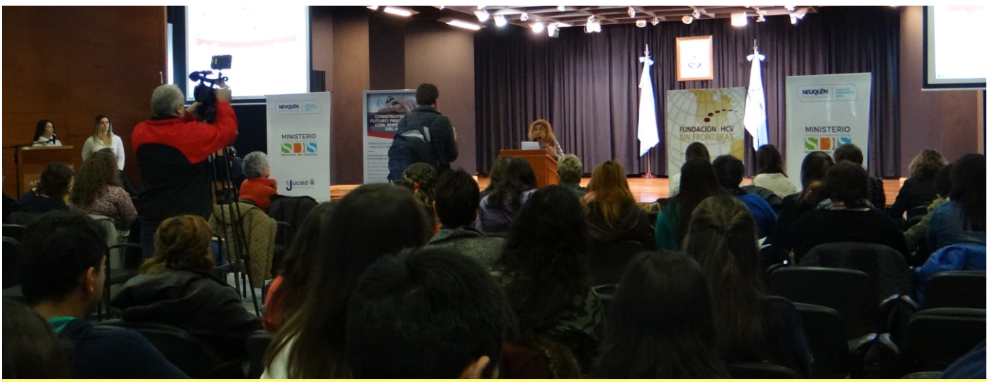
> Capacitación para efectores de salud de atención primaria y ONG's

Insistir sobre la defensa de los derechos de acceso a la salud fue un trabajo de capacitación realizado por voluntarios que recopilaron en hojas informativas asesoramiento legal para las personas enfermas.