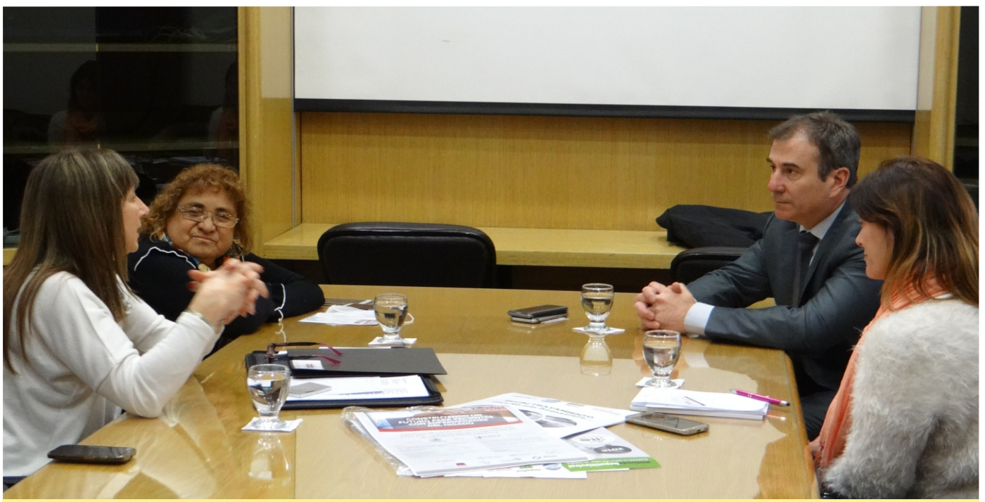
> Casa de Gobierno de Neuquén, reunión con Ministro de Salud Dr. Corrado Diez, ONG local Asociación Trasplantados y HCV Sin Fronteras

Realizamos una dedicada campaña con la recolección de testimonios sobre la necesidad de acceso universal a los tratamientos para hepatitis C, no hay que llegar a estar graves para curar una infección. Nuevas solicitudes presentadas al Ministro de Salud y reuniones con autoridades de Salud contribuyeron para que hoy dispongamos del acceso universal a los tratamientos.