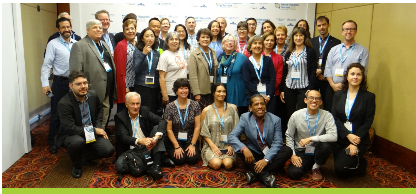
> HCVSF integra la Alianza de Referentes de la sociedad civil de hepatitis de las Américas.