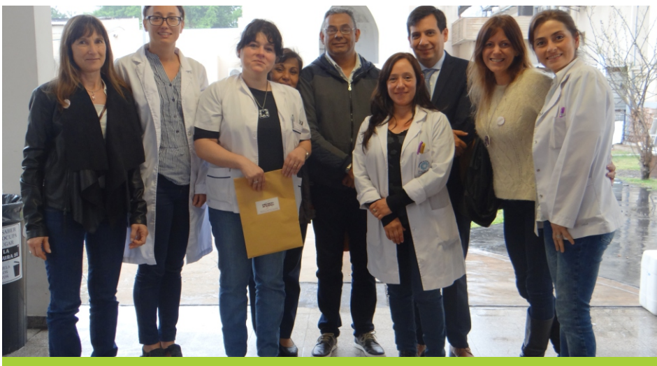
> HCVSF y Servicio de Hepatología y Trasplante hepático Hospital Padilla de Tucumán