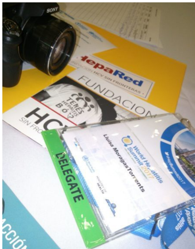
>World Hepatitis Summit San Pablo 2017

A través de nuestra red de ONG's de pacientes de hepatitis HepaRed, participamos en todos los talleres regionales sobre la formación del Plan estratégico 2018- 2021 para la eliminación de la Hepatitis viral en Argentina y nos capacitamos en talleres de gestión parlamentaria.